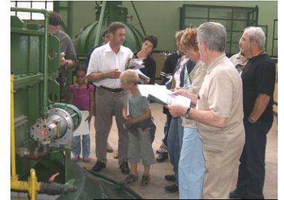
Visite de l'installation hydroélectrique

Afin de sensibiliser le plus grand nombre au thème des énergies renouvelables, il a été proposé, pour le grand public, une visite d'un site de production hydroélectrique appartenant à la Société Mahieu et Compagnie de M. Charmy à Blainville-sur-l'Eau.