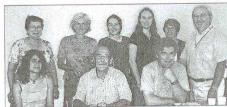
Tous les acteurs de l'opération accompagnement scolaire ont dressé un bilan positif.

Les personnes intéressées pour soutenir les élèves dans leur scolarité à la rentrée peuvent, dès à présent, contacter Alice Courroule au siège de la CCVM, 13 rue des Écoles à 54360 Blainville-sur-1 Eau ou au 03.83.71.43.82.