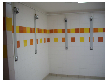
Douches des vestiaires accessibles depuis l'extérieur

Le conseil communautaire a approuvé le projet de réalisation d'une extension de la salle des sports du Haut des places, ainsi que la conclusion d'une mission de maîtrise d'œuvre (mission de base), d'une mission de coordination SPS et d'une mission de contrôle, le tout pour un montant prévisionnel total TTC de 70 000 €. Les travaux ont été commencés durant le second semestre 2007 et se sont poursuivis en 2008.