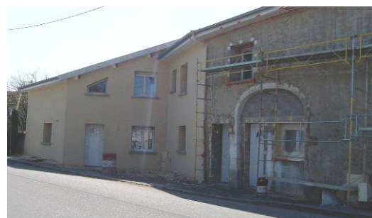
Façade en ravalement à Mont sur Meurthe

quasi-totalité de l'enveloppe de 36 500 € a été consommée. La moyenne de l'aide octroyée pour un ravalement de façades est de 1 031 €.