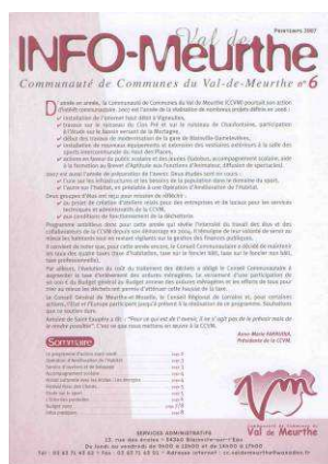
BIC d'avril 2007

En 2007, la CCVM a publié un Infos Val de Meurthe.