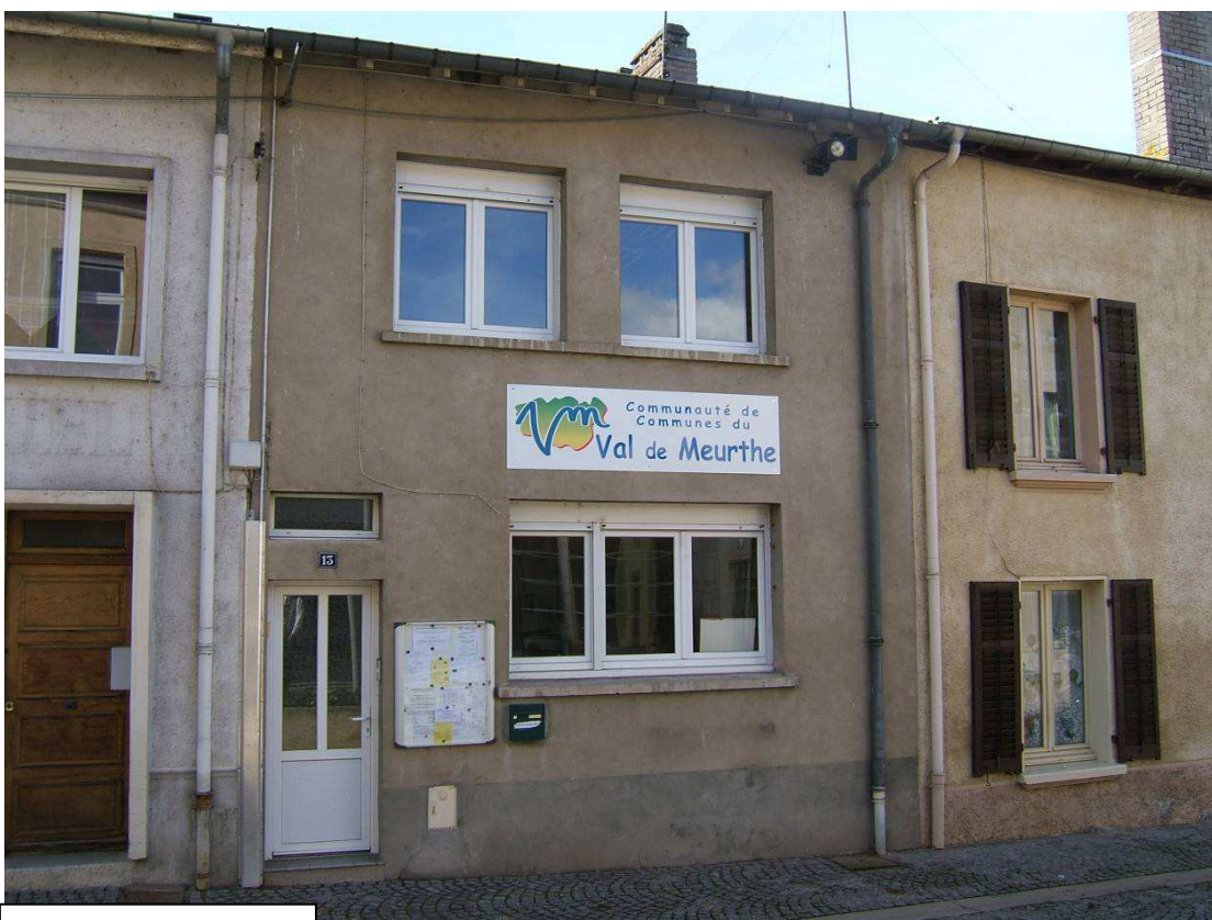
Locaux de la CCVM

Les statuts de la CCVM ainsi que les deux délibérations mentionnées sont joints au présent rapport.