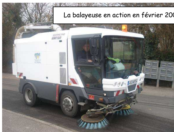
La balayeuse en action en février 2007