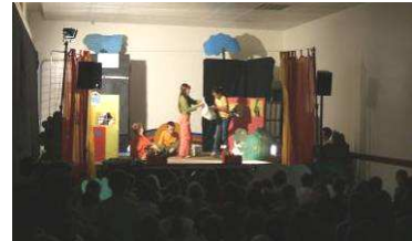
Pièce de théâtre