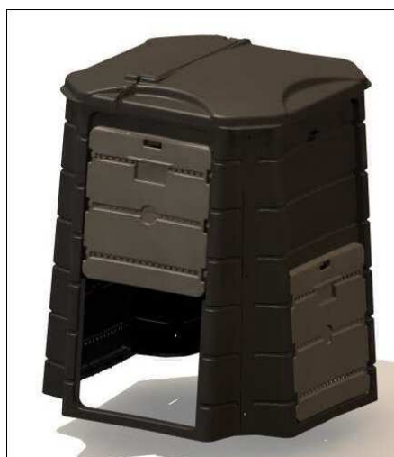
Composteur PICUMNUS d'ECD

La Communauté de Communes du Val de Meurthe n'a pas participé à l'opération sur ses fonds propres, les composteurs étant revendus aux habitants à prix coûtant.