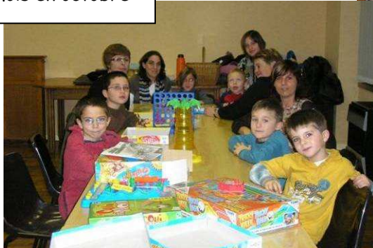
Charmois en octobre

Le bilan de cette première année de fonctionnement a confirmé la volonté de la CCVM de poursuivre l'action. Ainsi, le Ludobus a été renouvelé pour l'année scolaire 2007-2008 dans les mêmes conditions mais en prenant en compte les problèmes rencontrés la première année. La convention avec l'association Relais a donc été renouvelée. Pour améliorer le service, la CCVM a, par exemple, accentué la communication sur certaines communes où le Ludobus rencontrait moins de succès.