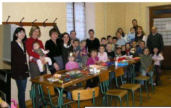
Le Ludobus à Barbonville

Coût 2007-2008 : 4 500 € versés à l'association relais en trois fois, tous les trimestres, sur présentation du rapport trimestriel. (50 % CG54, 50 % CCVM)