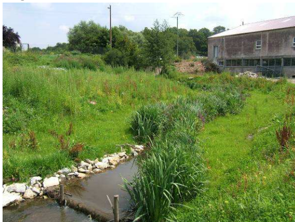
Le Clos Pré à l'été 2007

Les travaux optionnels, prévus lors de la passation du marché, qui consistaient en travaux et plantations en amont au niveau de la partie forestière du ruisseau et le long de la voie SNCF en aval, n'ont pas été réalisés. La maîtrise d'œuvre a donc coûté moins cher que ce