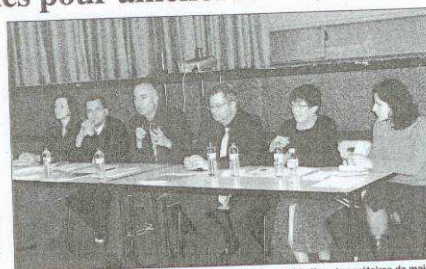
Les responsables de la CCVM et d'URBAM Conseil ont invité les élus et secrétaires de mairie à relayer l'information auprès de la population.

Il en sera de même pour les conseils (gratuits) prodigués par les techniciens spécialisés d'URBAM CONSEIL qui se tiendront à disposition du public pour informer dans le détail de la nature des travaux, des conditions d'obtention, des financements éventuels complémentaires ou aides fiscales.