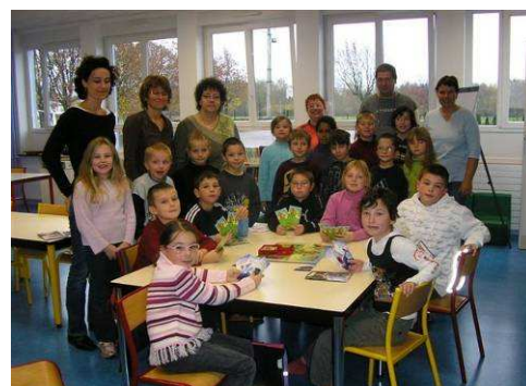
Intervention de Natura Passion à l'école du Haut des Places

Le 17 septembre 2007, une réunion de lancement de l'opération a été organisée avec les enseignants des classes de CE2 volontaires. Lors de cette réunion, la CCVM a décidé de distribuer un guide du tri de la CCVM à chaque enfant participant à l'action et il a été annoncé la visite de l'entreprise de compostage Betaigne environnement, partenaire de la CCVM, en complément des interventions de l'association. Cette réunion a également permis de fixer les dates des interventions. Les quatre premières sur les sept prévues ont eu lieu au cours des mois de novembre et décembre 2007. La dernière intervention était prévue pour le mois de février 2008.